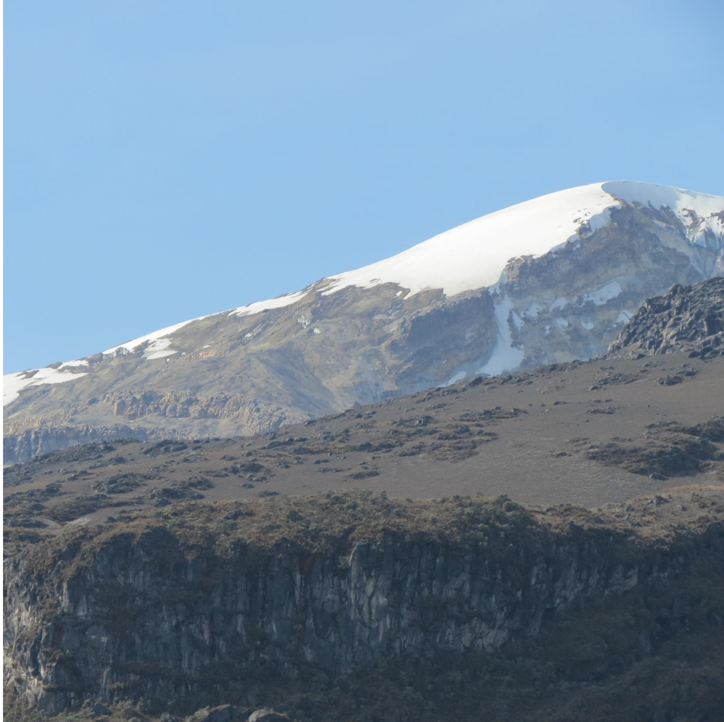
Nevado del Ruiz – Cara Norte 2021