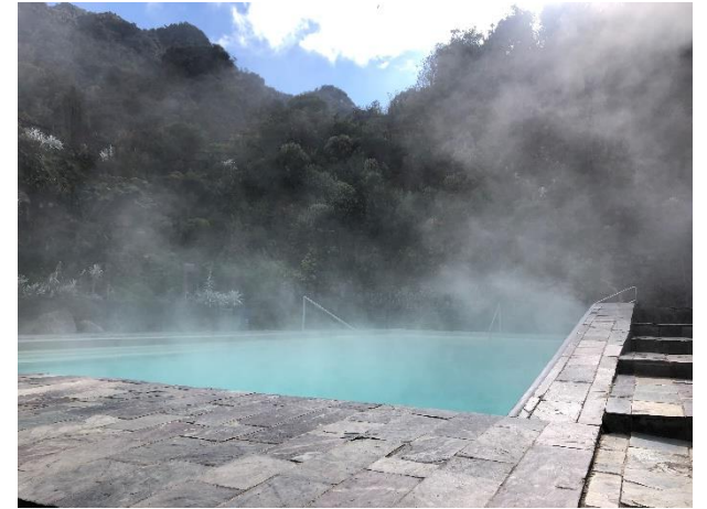
Termales del Ruiz 3.500 m.s.n.m.