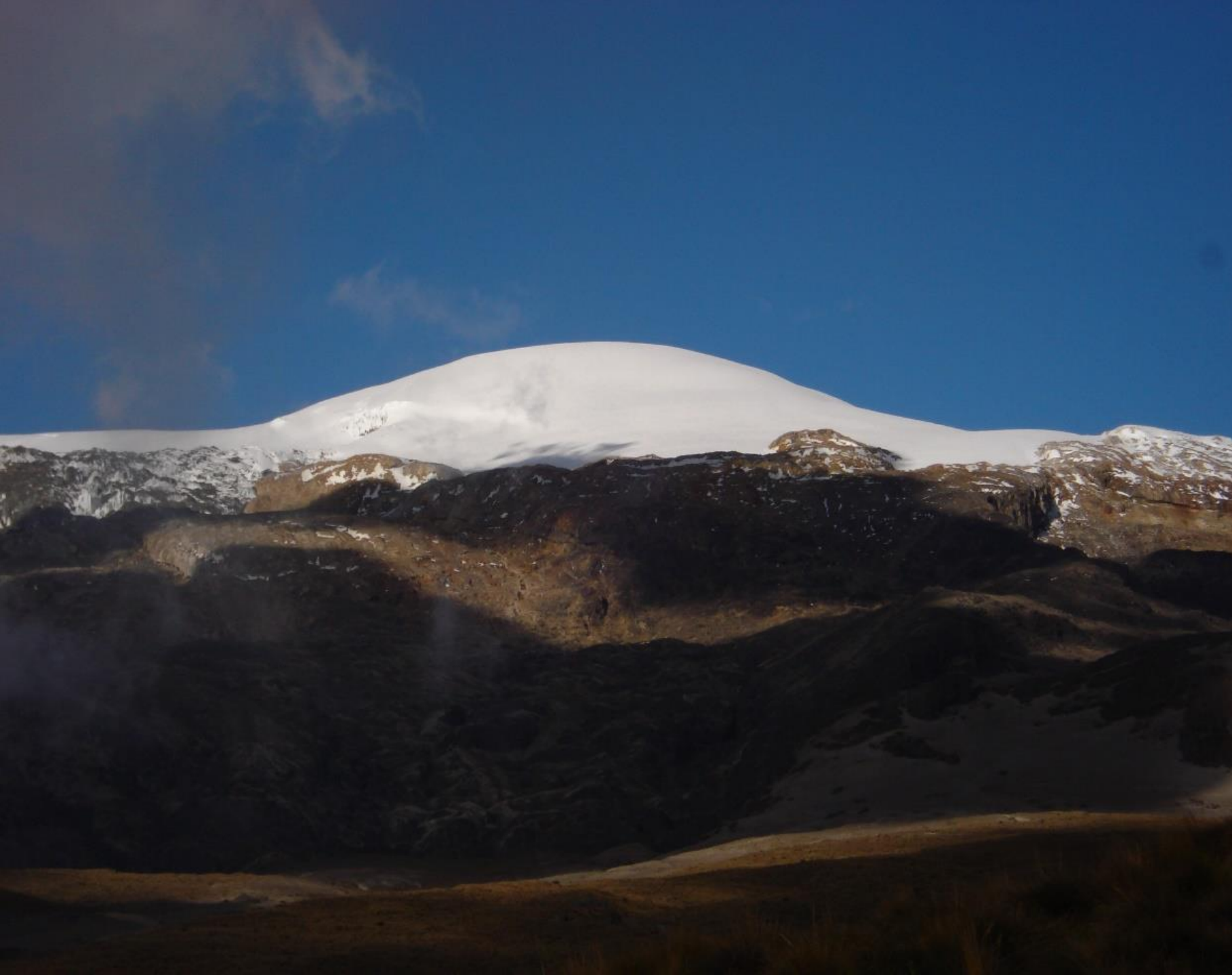
Nevado Santa Isabel - Parque Nacional Natural los Nevados Peña E. 2007