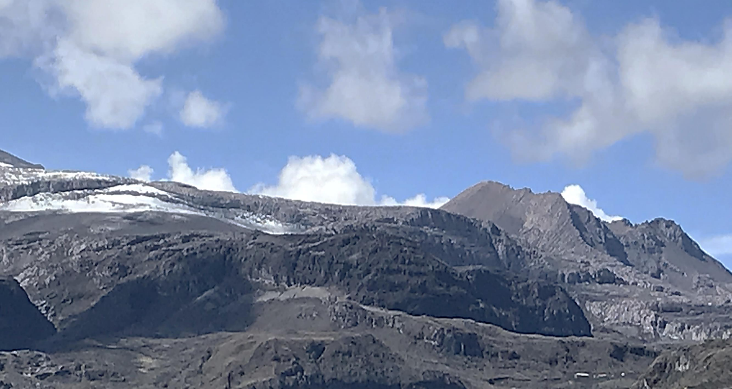
Parque Nacional Natural los Nevados: Cráter de la Olleta - 2022