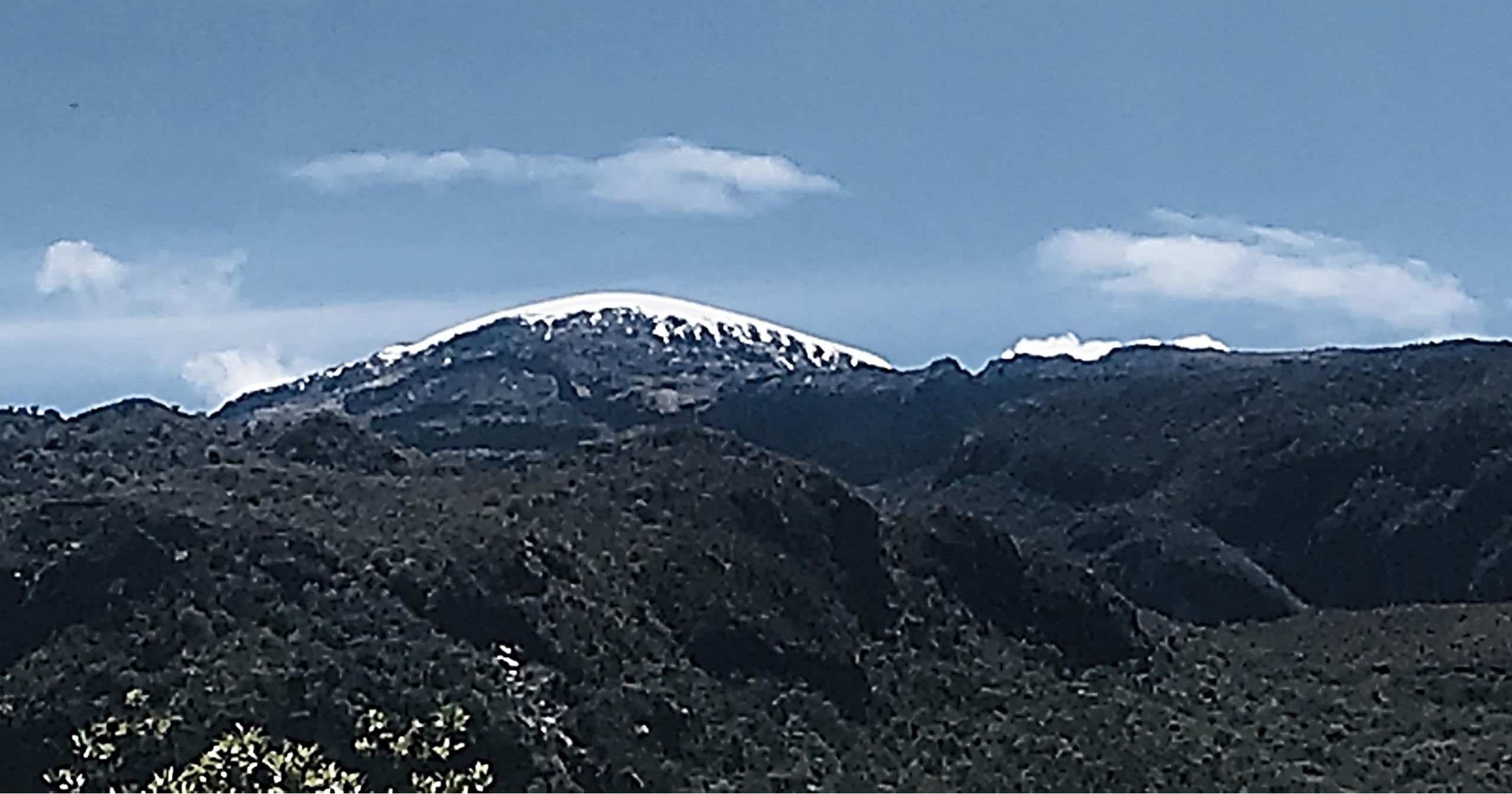
Parque Nacional Natural los Nevados: Nevado Santa Isabel - 2022