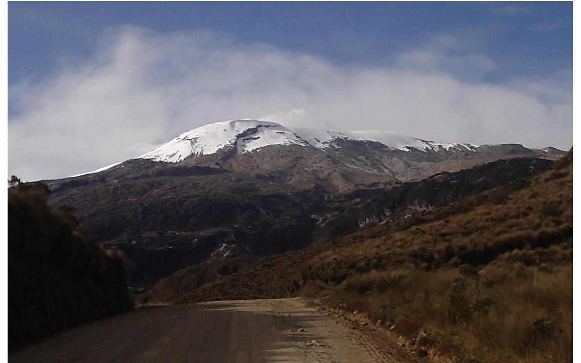
Acceso Nevado del Ruiz 2007